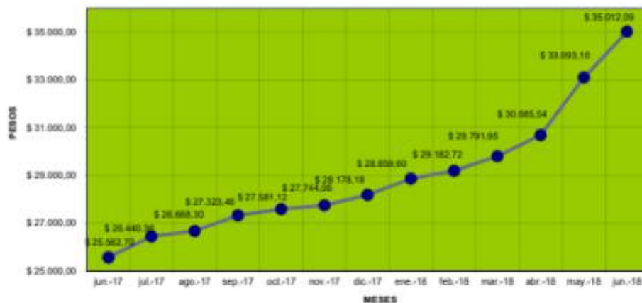
VALOR M2 OFICINAS LEED SILVER

Este índice se publica no solo en el Newsletter de la página web http://www.esarq.com.ar/ , sino que también es publicado por el Consejo Profesional de Arquitectura y Urbanismo y por el Argentina Green Building Council.